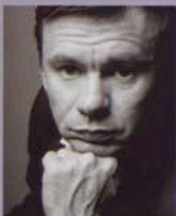
Pavlo Tolstoy tenor