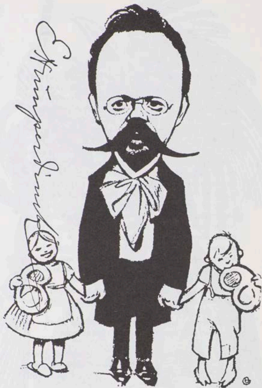
Anonimowa karykatura Humperdincka z autografem kompozytora.