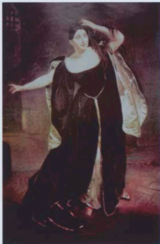
Giuditta Pasta w roli Anny Boleny, obraz Karla Briullova