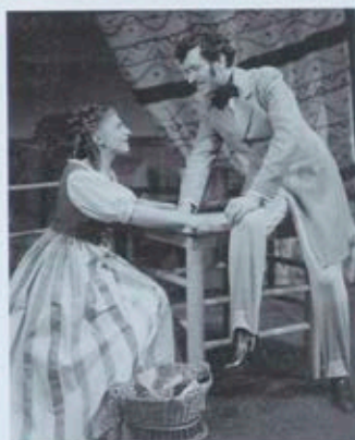
■ D. Debichowa, S. Heimberger Don Pasquale , 1955