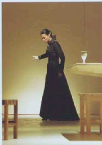
J. Woś, Lukrecja Borgia , 2004