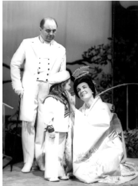
Madame Butterfly (Cio-Cio-San), 1971