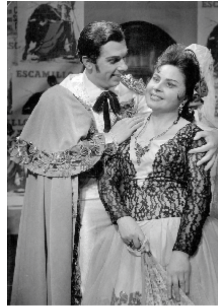
Carmen (Escamillo), 1967