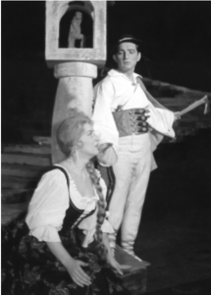
Halka , 1967