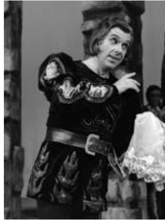
Otello (Jagon), 1976