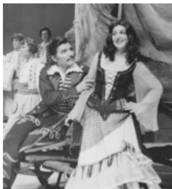
Baron cygański (Saffi), 1975