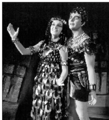
Aida (Aida), 1970