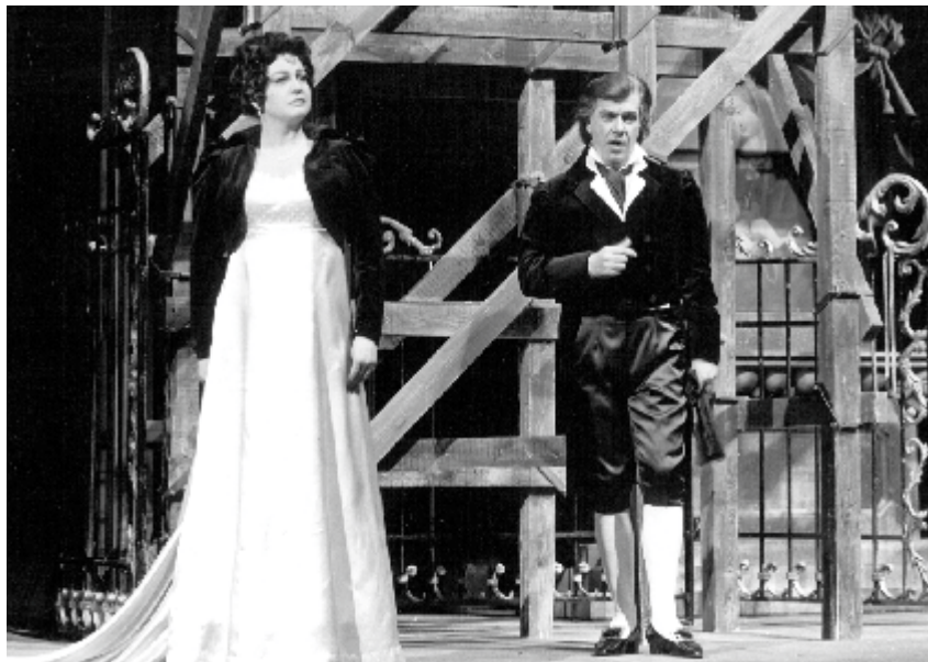
Tosca (Scarpia), 1988