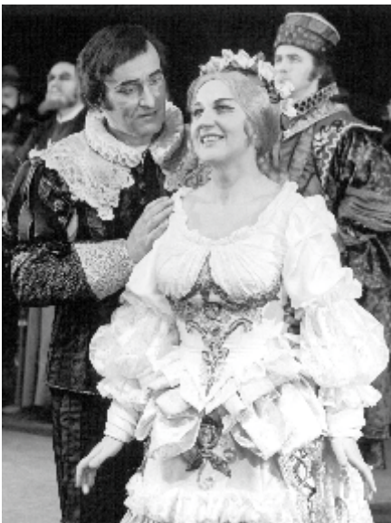
Wolny strzelec (Agata), 1978