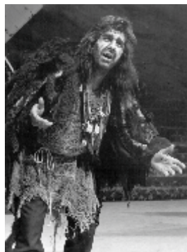
Manru (Urok), 1984