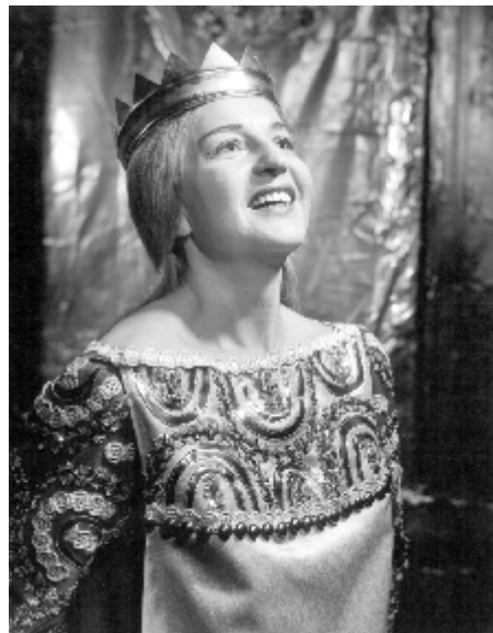
Lohengrin (Elza), 1970