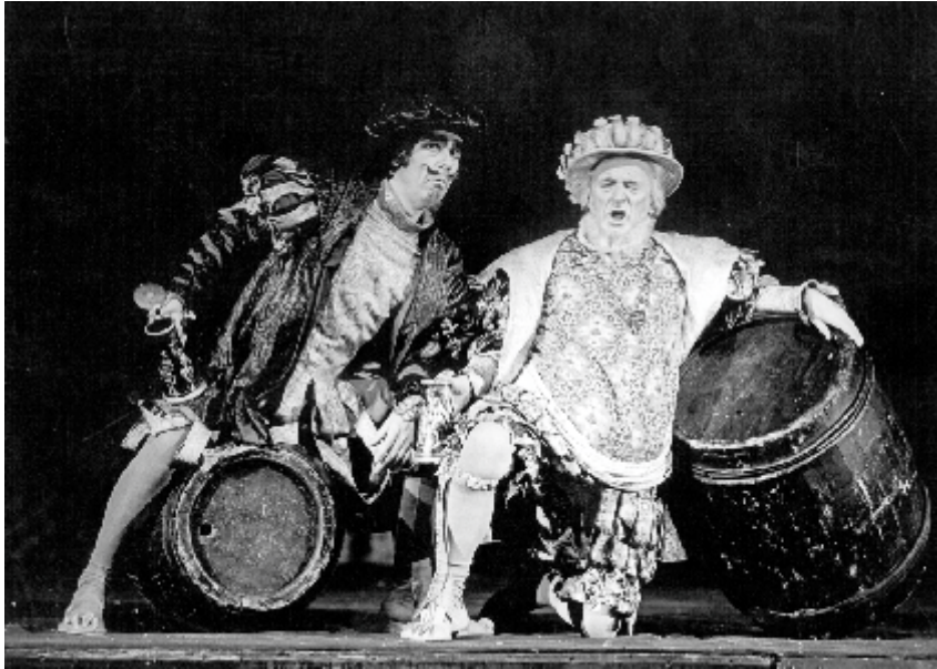
Wesołe kumoszki z Windsoru (Pan Fluth), 1973