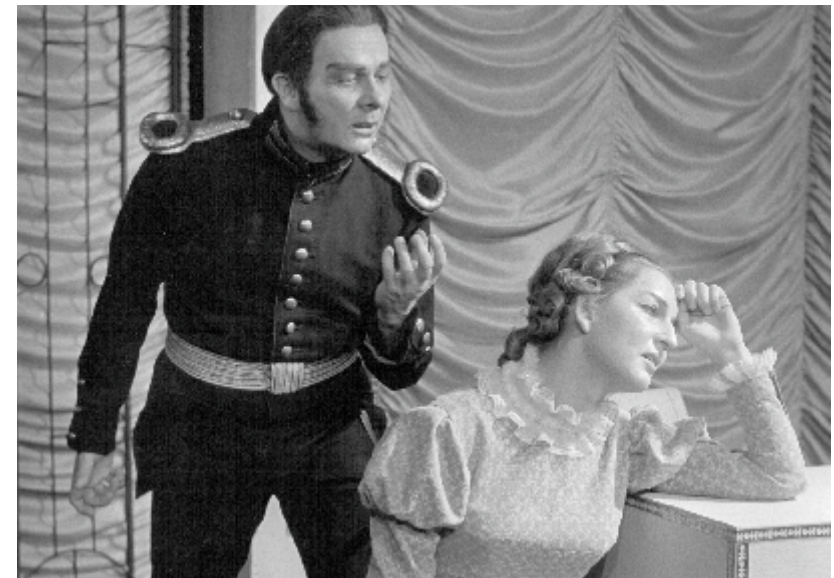
Dama pikowa (Liza), 1967