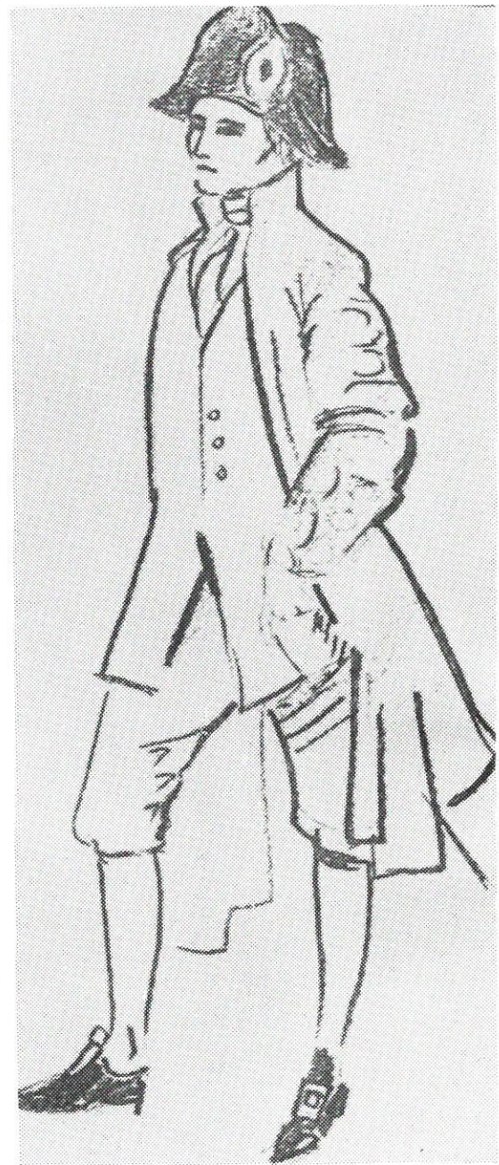
Projekt kostiumu I oficera