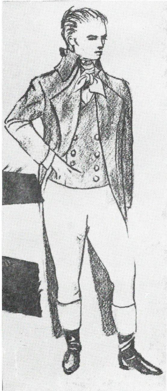
Projekt kostiumu André Thorela